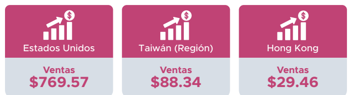
Cifras en millones de dólares estadounidenses.

Los países que fueron el principal destino de estas ventas fueron Estados Unidos, Canadá y El Salvador.